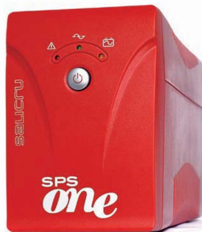
► SPS One