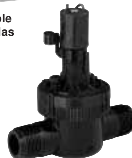
Válvulas de la serie EZ-Flo® Plus