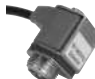
Conjunto de solenoide CC