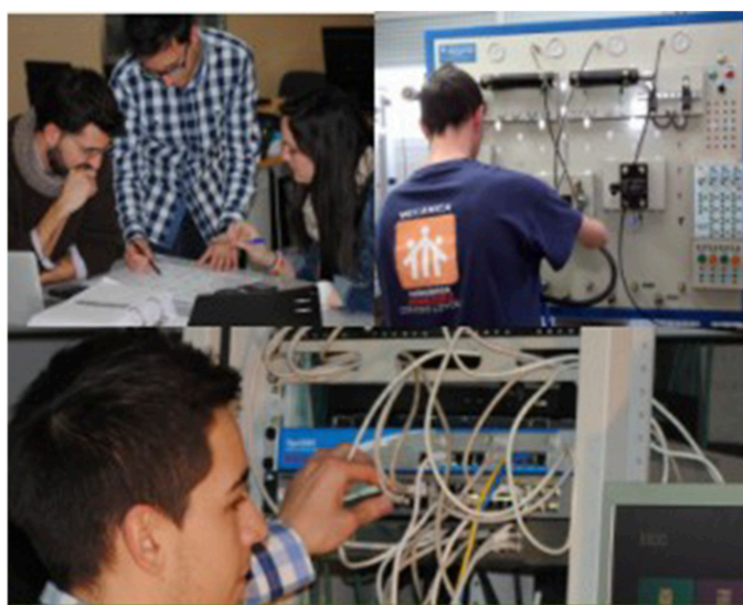
Ciclos Formativos GRADO SUPERIOR