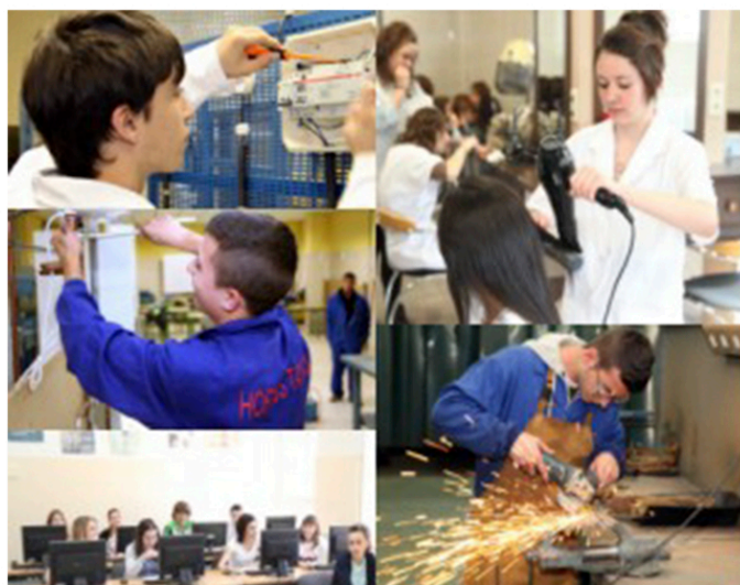
Ciclos de Formación Profesional BÁSICA

Texto consolidado Mediante RD 560/2010, de 7 de mayo