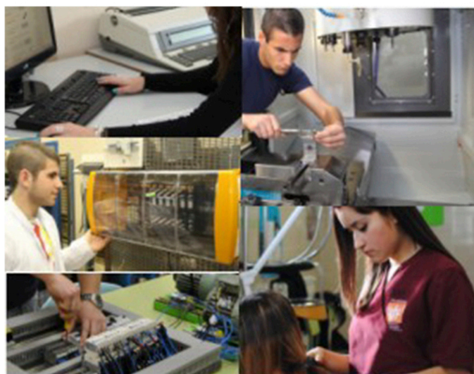
Ciclos Formativos GRADO MEDIO