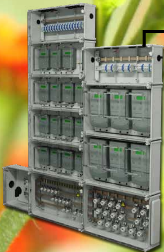
Centralización Contadores con Contrato de Compañía