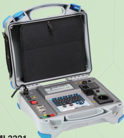
MI 3321 Multiservicer XA Cod.: 602200087