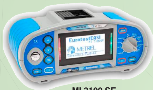
MI 3100 SE Cod.: 602200103