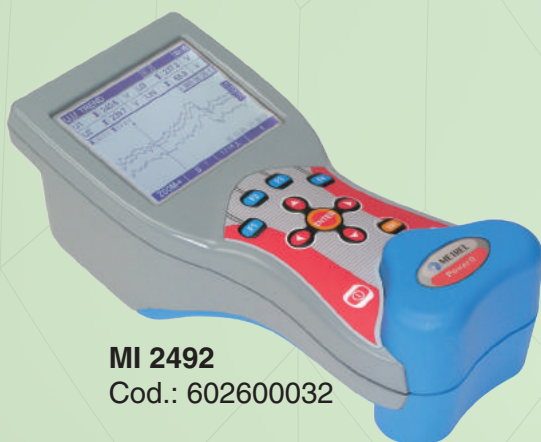
MI 2492 Cod.: 602600032